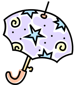
日傘のクリーニング

スーパーバイオはファッションクリーニング、ハウスクリーニングから食品工場や大学の研究施設など幅広い業種でご利用頂いています。