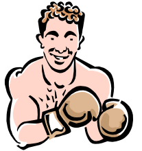
ボクシングなどのワセリン