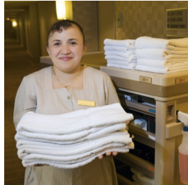
ホテルのバスタオル